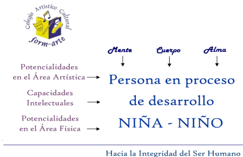
Fig. 1. Ámbitos del Desarrollo Humano.

Un trabajo que aborde la integridad del Ser Humano, desde sus primeras etapas, habría de considerar una estrategia que incluya los tres ámbitos y las capacidades señaladas. (Ver Figura 1).